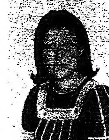
تفوية لرحومة بين الشماي

كثفت نهاد طوبالين: بعد بنك العين، هل ينجح انشاء بنك الكلى في لبنان؟ سؤال مطروح، خصوصاً وان الولا من اللبنانيين يغلبون كلاً من ثلاث مرات اسبوعياً. الجواب على هذا السؤال يفترض تحوّل ثلاثة معطيات هي: ● عدد وافق من الوامين لكلامهم بعد الوفاء وتوقيع ذويهم بتنفيذ وصاياهم. ● مساعدات مالية من قبل الجمعيات الانسانية، لان مثل هذه العمليات مكلف للغاية خصوصاً مع جثث الدولار. ● مركز مثل هذه العمليات، وقد توهر في مستشفى رزق.